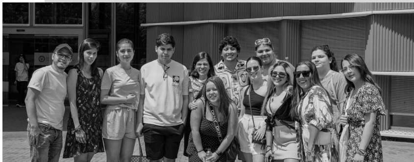
ALUMNOS PARTICIPANTES EN PROGRAMAS ANTERIORES